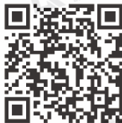
联机系统软件操作说明