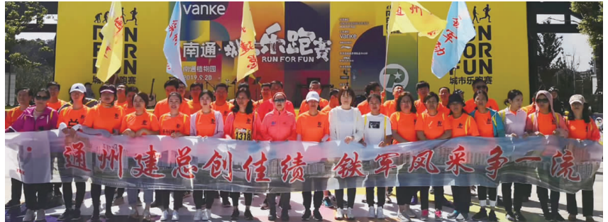
公司机关组织参加南通市乐跑赛