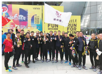
徐州分公司组织参加城市乐跑赛