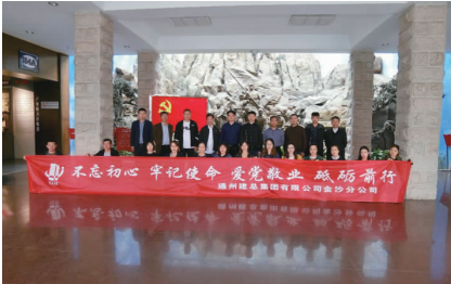
金沙分公司开展主题教育