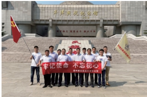
天津分公司“七一”节参观平津战役纪念馆