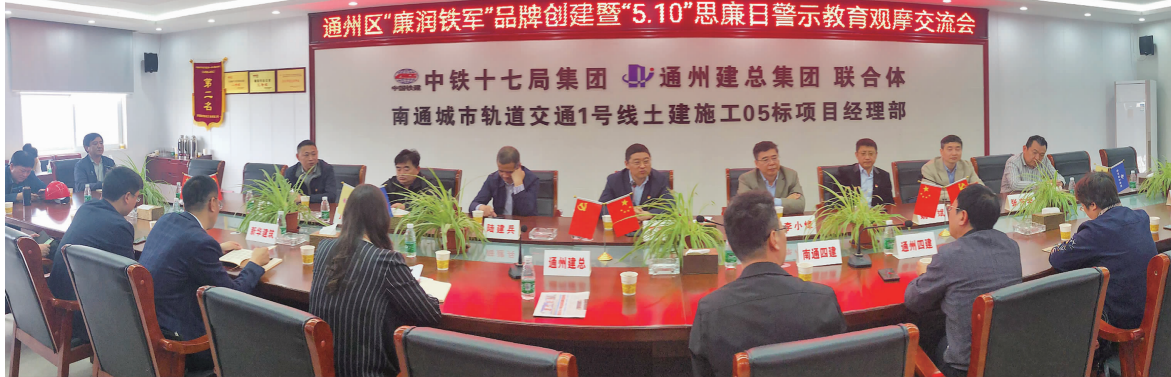
通州区纪委在公司轨道项目部开展 510 思廉日活动