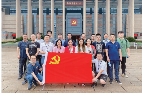
上海公司开展庆“七一”参观南湖纪念馆活动