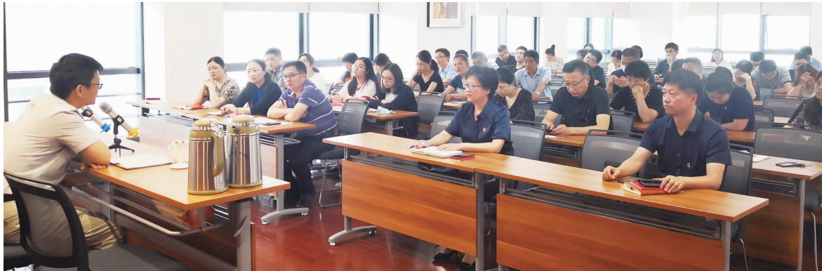
公司机关党支部与鑫汇公司党组织联合开展党建融创活动