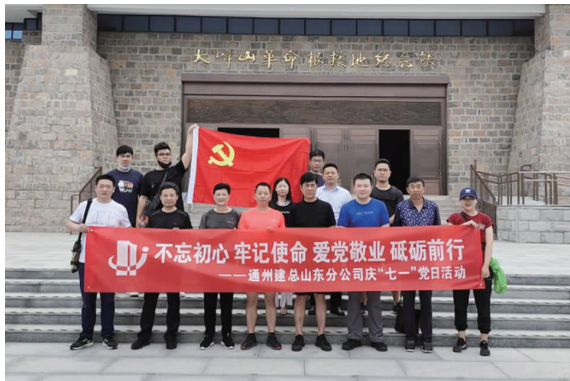
山东分公司开展庆“七一”主题党日活