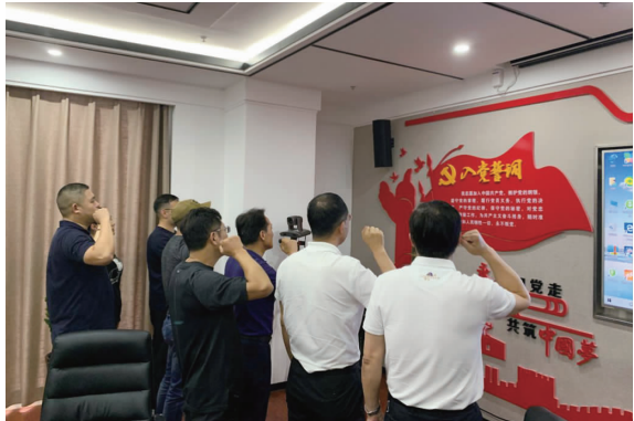
徐州分公司组织开展“七一”主题党日活