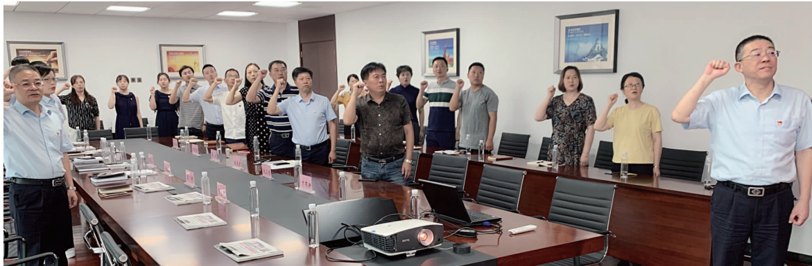
通州建行党组织与公司机关党支部开展党建联学共建活动