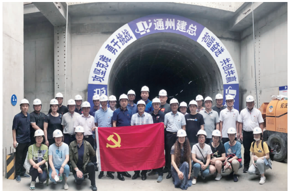
南通体育职业学院党组织与公司轨道项目部党支部开展党建联谊活动