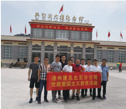
北京分公司组织开展党建爱国主义教育