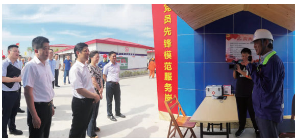
与会人员参观项目党员先锋模范服务岗