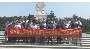
苏州分公司组织参观焦裕禄同志纪念馆