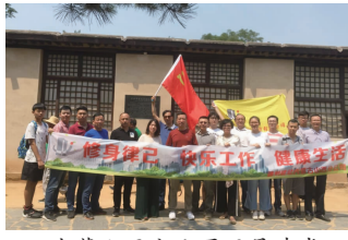
内蒙古西分公司开展建党79周年庆祝活动