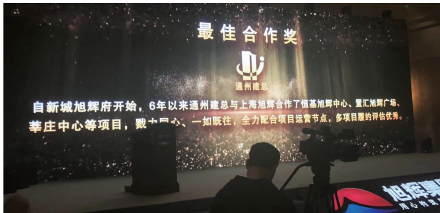
集团公司获“旭辉集团年度最佳合作奖” 陈秋嫣 / 供稿

经理受邀参加,会议期间与万科集团领导就双方的战略合作进行了亲切交流,集团公司获评“2017 年度持续领先奖”。 目前,公司和万科集团新一轮合作已经全面展开。随着合作的深入,公司将充分发挥质量过硬、多方位配合的优势,为战略合作伙伴提供优质产品,努力实现共享共赢。