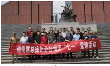
徐州分公司开展庆“七一”活动