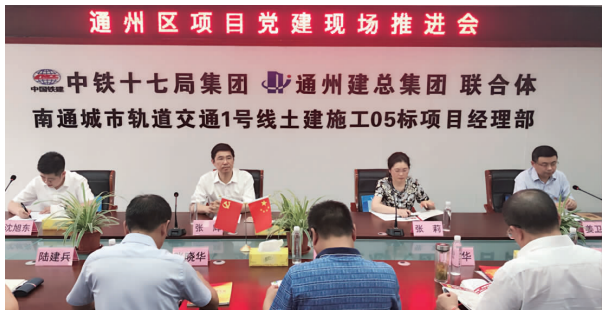
项目党建现场推进会会场