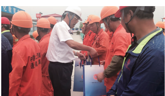
区总工会主席黄春雨慰问工人