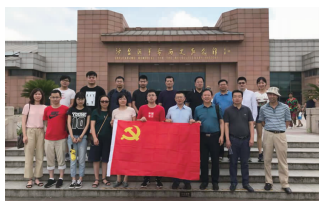
上海分公司开展建党节主题活动