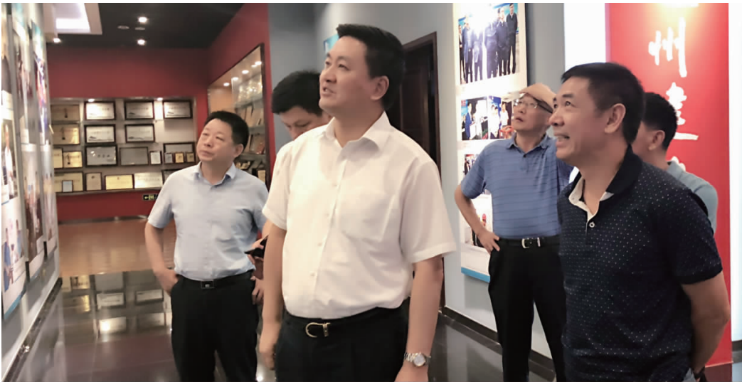
南通市委副书记张兆江考察公司,董事长兼党委书记张晓华陪同。