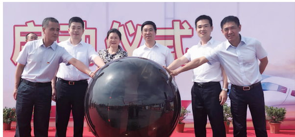
行为安全之星启动仪式