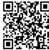
环保产业创新发展大会