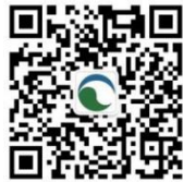
中国国际环保展览会