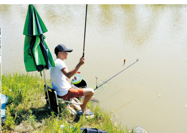
6月23日上午，四海炼化团支部在信心村鱼塘组织开展2016年“快乐工作，快乐生活”休闲垂钓比赛，充分展现了金澳青年员工团结友好、勇于拼搏的精神面貌。