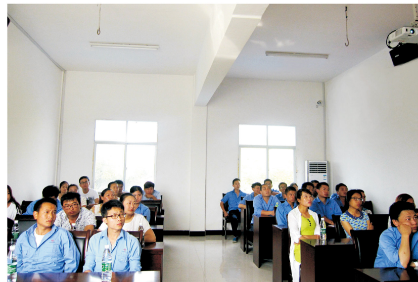
7月1日是中华人民共和国建党95周年，为迎接党的生日，提高青年团员的思想认识，6月30日，油品储运团支部组织开展“永远跟党走”主题教育活动。会上，大家观看并学习了“优秀共产党员”的先进事迹，齐声朗读《优秀员工宣言》，并签订了承诺书。