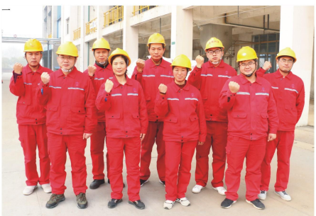
聚丙烷一班 一个小时就完成了阀门更换工作，及时保证了生产工况的稳定。 在以后的生产过程中，聚丙烷

聚丙烷车间一班严抓班组管理，提高生产现场管理水平，班员们齐心协力，在车间十月份的生产工作中，取得了班组排名第一的好成绩。 班长资料坚持严抓班组纪律，强化班组管理，努力提高班组内部凝聚力和战斗力。生产过程中，合理安排各项工作，注重细节，没有出现过一起违规违纪现象。全体班员精心操作、互相提醒。在热水罐温度和液位、气柜高度的控制操作中，连续一个月未出现不合格操作记录。班组十月份工艺合格率达到四个班中遥遥领先。