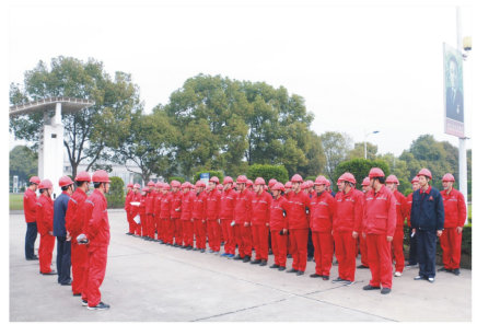
时刻绷紧安全之弦 确保企业安全生产

演练开始,操作工在泵房区巡查时发现减温减压器发生泄漏,立即通过对讲机通知当班班长。此时泄漏量突然增大,现场已不再安全,班长当机立断,带人打开减温