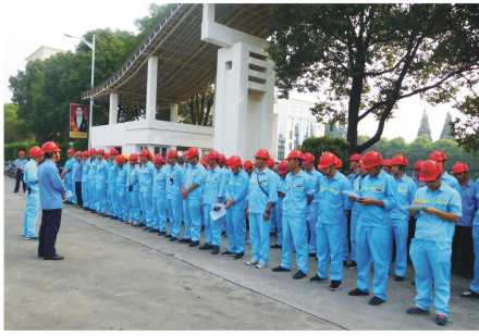
本报讯(记者 宋伟智)为落实湖北省安委会办公室下发的《高温危险化学品安全生产工作

的紧急通知和潜江市《应急管理局紧急通知》,7月2日,金澳科技安委会组织安全环保处、设