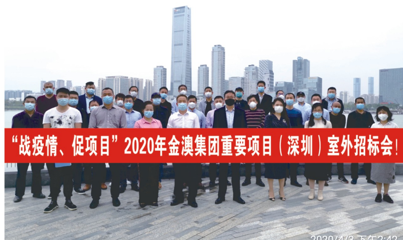
“战疫情、促项目”2020年金澳集团重要项目(深圳)室外招标会!