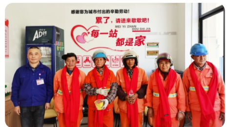
红围巾送温暖 系上关怀与祝福 集团恒优公司户外劳动者驿站已经成立

休息室内配备了多人软皮座椅、办公桌及多个柜子,空调、饮用水、电热水壶等一应俱全。天愈发冷了,正该进屋暖暖捧一杯热茶在手,驾驶员可以在此小憩,补充水分的同时得到充分休息,当疲劳得以缓解,再次出发时安全隐患便大大降低了。此举深受广大驾驶员好评,也充分体现了公司以人为本的理念。