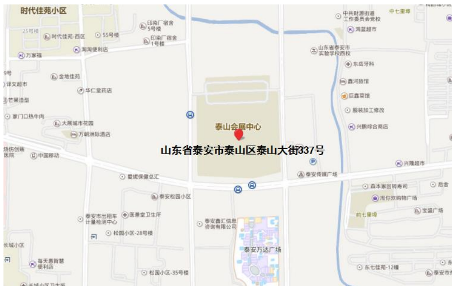
图 1 会议地址