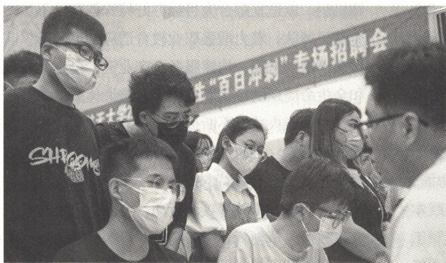
>> 2022年5月29日，来自航空、船舶、通信等高精尖行业的企业走进南京高校招揽人才

立足服务国家区域发展战略，优化区域教育资源配置，提升教育服务区域发展战略水平。更好发挥教育在国家重大区域战略中的服务、引领和支撑作用，加快形成与国家区域发展战略、生产力布局和城镇化建设要求相适应的多层次、多样化教育布局。统筹振兴乡村教育和教育振兴乡村，助力乡村振兴战略实施。坚持共赢共生，优化教育对外开放全球布局，深化中外人文交流，打造“一带一路”教育行动升级版，扩大教育国际公共产品供给，深化与重要国际组织合作，同世界一流资源开展高水平合作交流，提升层次和水平，以高水平对外开放促进教育改革的持续深化和发展质量的不断提升。