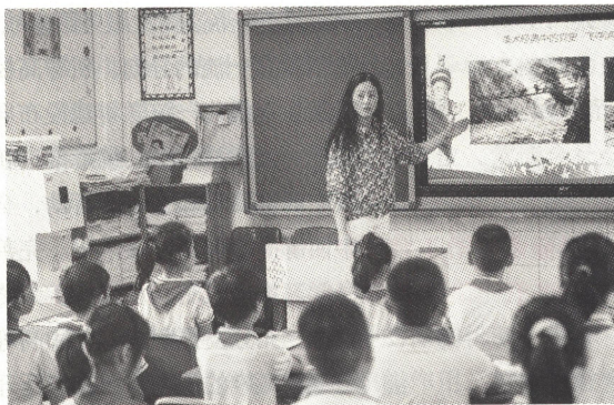
>> 重庆市九龙坡区铁路小学举办党史教育进课堂主题活动，为学生讲述优秀共产党员成长故事

一是落实立德树人根本任务，坚持不懈用习近平新时代中国特色社会主义思想铸魂育人。 从党和国家事业后继有人的战略高度，践行为党育人、为国育才的初心使命，坚持用习近平新时代中国特色社会主义思想教育人，用党的理想信念凝聚人，用社会主义核心价值观培育人，用中华民族伟大复兴历史使命激励人。把立德树人融入思想道德教育、文化知识教育、社会实践教育各环节，贯穿基础教育、职业教育、高等教育各领域，体现到学科体系、教学体系、教材体系、管理体系建设各方面，把立德树人的成效作为检验学校一切工作的根本标准。持续推进党的理论进教材、进课堂、进头脑。实施深化新时代高校思政课改革创新提升工程，善用“大思政课”，统筹做好思政课程和课程思政建设。坚持知识传授和价值引领相统一，壮大建强学校思政工作队伍。构建德智体美劳全面培养的教育体系，形成更高水平的人才培养体系，全面推进“三全育人”综合改革。统筹加强和改进新时代学校体育美育，充分发挥劳动综合育人功能，着力增强学生文明素养、社会责任意识、实践本领，促进学生综合素质提升。继续把“双减”工作摆在突出位置、重中之重，巩固成果、健全机制，营造良好育人生态。发挥学校教育主阵地和