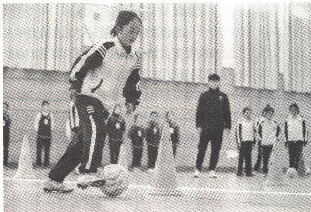
>> 山东省青岛市即墨区青岛通济实验学校深入开展校园素质教育。图为足球社团学生在练习运球。

社会主义教育事业最本质的特征，系统回答了新形势下培养什么人、怎样培养人、为谁培养人这一根本问题，指明了加快推进教育现代化、推动教育高质量发展的根本方向和根本任务。