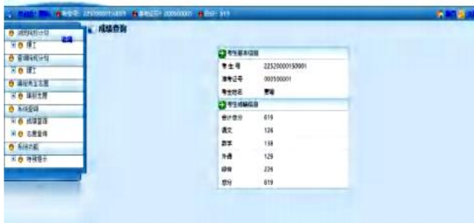
贵州省2022年普通高校招生志愿填报系统