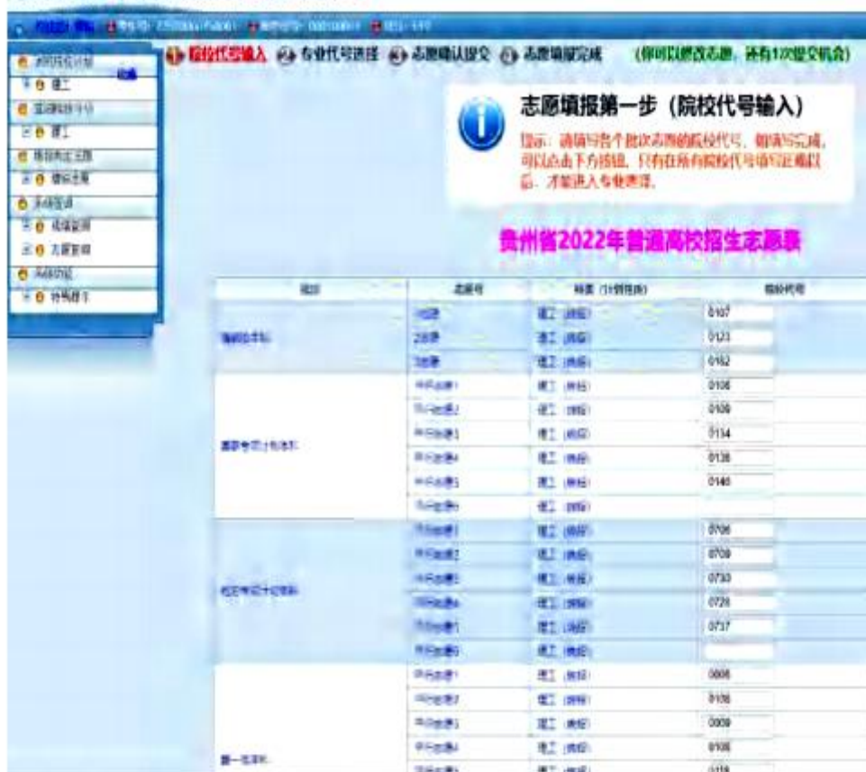
贵州省2022年普通高校招生志愿填报系统

2. 考生按照本人事先填写好的《贵州省2022年高考志愿纸质样表》，输入院校代号并认真核对院校名称是否正确。