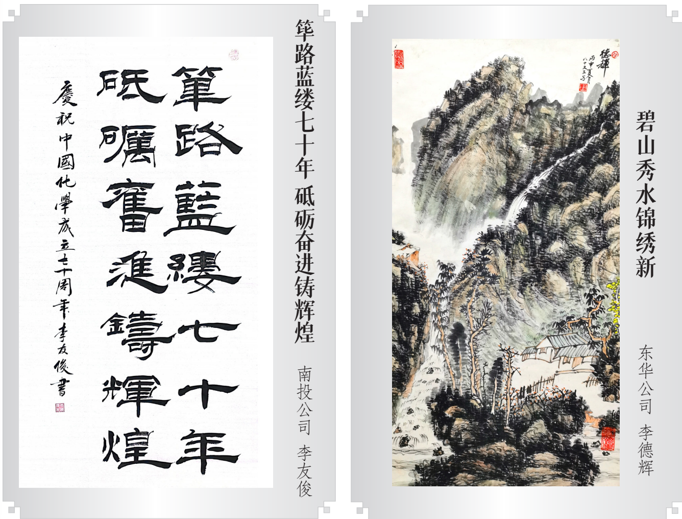
筚路蓝缕七十华诞 砥砺前行铸辉煌

任凭风浪起，行稳远航。 四面战鼓进军号，八方喜讯接踵来。 新征程，风流化学人，高歌奏。