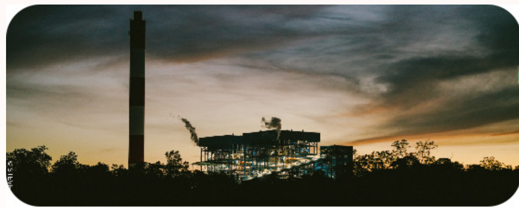
融入自然与夕阳中的Kaltim2电站全貌

下一步，研究院将认真践行集团公司“两商”发展战略，加快推进两个项目落地进程，为集团公司实业发展做出新的贡献，以优异成绩迎接集团公司成立70周年。