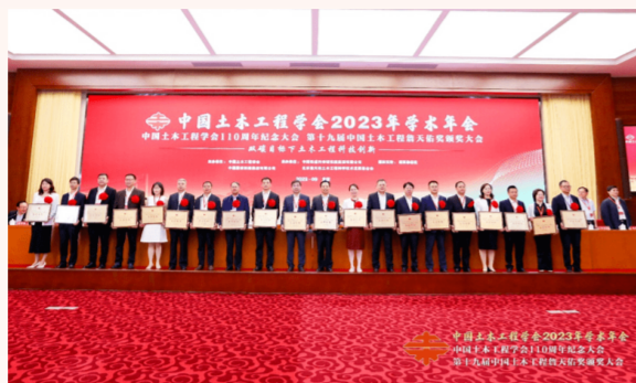
第十九届中国土木工程詹天佑奖颁奖大会在北京隆重举行，交建公司所属水公司参建的黄浦江上游水源地工程获此殊荣。

中国土木工程詹天佑奖是中国土木工程领域最具影响力、最具权威性的科技创新大奖，由中国土木工程学会和北京詹天佑土木工程科学技术发展基金会联合设立，以奖励和表彰在科技创新特别是自主创新