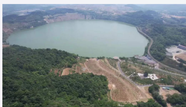
新晋网红打卡热地——凹山湖

经过一年来的不懈努力，“千疮百孔”的向山地区处处“身披绿衣”，曾经是亚洲最大露天铁矿坑的凹山湖被打造成了青山绿水、花草繁茂的“凹山湖”，并一度成为了新晋网红的打卡热地，受到了省、市、区政府和当地群众的一致认可。