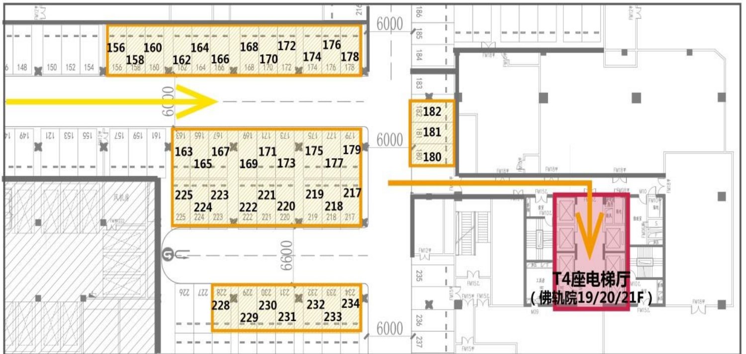
佛轨院员工专用停车区具体车位编号示意图。

由文华南路一侧的地下车库入口（靠近保利中心主楼）进入负一层车库。 左拐5m后右拐，直行约80m到达佛轨院员工专用停车区（该方向的端头）；非佛轨院登记的外来车辆请配合物业停泊在其他车位。 由180号车位处的入口进入通往T4座电梯厅的通道，佛轨院位于该座19/20/21F（前台位于21F）。