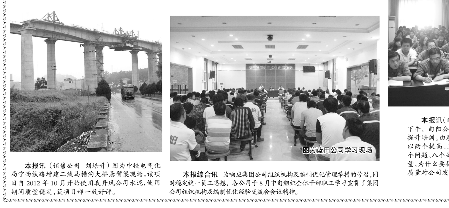
图为本田公司学习现场