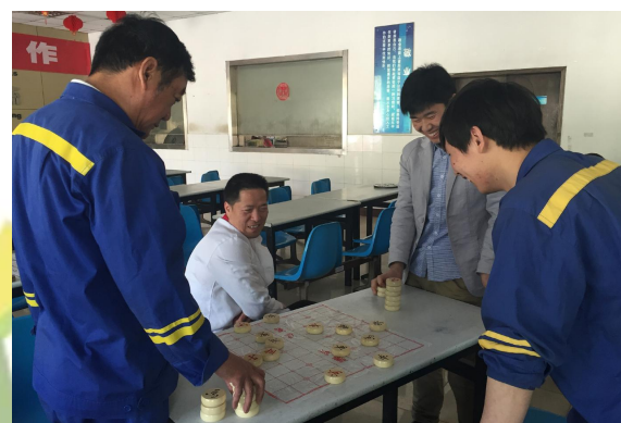
镇安公司 象棋 跳棋比赛