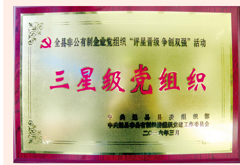
近期,勉县公司在非公有制企业党组织“评星晋级、争创双强”活动中,被勉县县委组织部授予三星级党组织荣誉称号。 (勉县公司 曹淑娟)