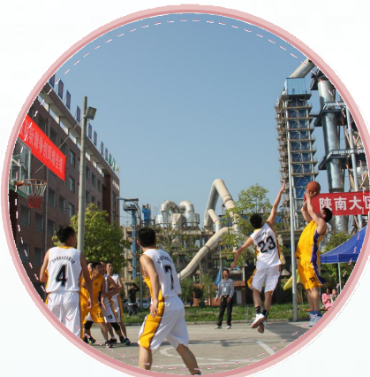
陕南大区 篮球友谊赛