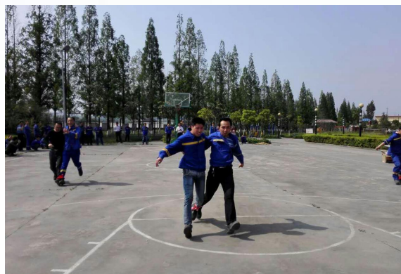
洋县公司 绑腿跑 拔河比赛