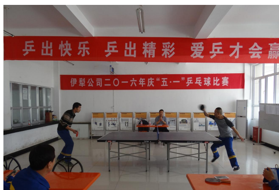
伊宁公司 乒乓球比赛