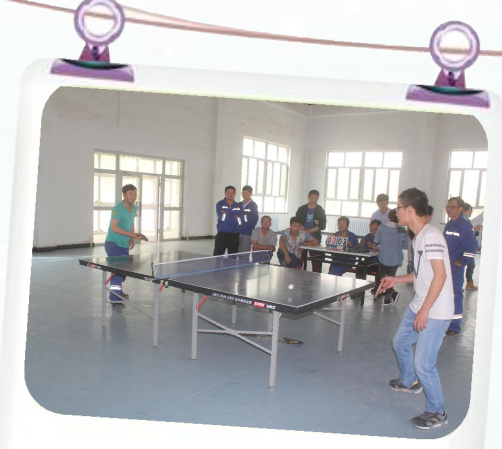
和田公司 乒乓球 拔河比赛