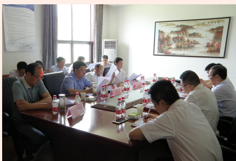
6月13日上午,中共勉县县委书记马大勇、县长马仕强、副县长赵文哲、县委常委县委办主任朱均一行,在县政府办、经贸局、统计局、考核办、国土局、环保局、金泉镇的陪同下来勉县公司调研。(勉县公司 吴文)