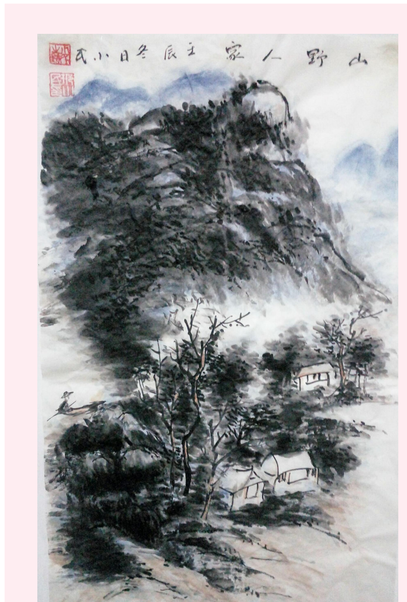
国画 丹凤公司 邢小民

为公司的发展紧握的绵薄之力。我所工作的岗位属于服务性窗口,不论是现在还是今后,我每天都会以一个良好的精神面貌和热情的态度去为任何一名员工,要做到永无止境,争取做一名尧柏水泥优秀员工。(和田公司 张碧云)