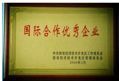
光信公司荣获“2017年度国际合作优秀企业”称号

本报讯(蒲城公司 李敏)3月20日蒲城公司应邀参加了蒲城县安全生产委员会,并荣获“2017年度安全生产先进经营单位”称号。有力的促进了县域安全生产形势的持续稳定,同时蒲城公司坚守发展决不以牺牲安全为代价这条不可逾越的红线,保持良好的工作作风,坚持“安全第一、预防为主、综合治理”的方针,不忘初心,再接再厉,扎实做好2018年度的各项安全生产工作,为确保全县安全生产形势持续稳定作出更大的贡献。