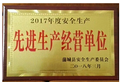
蒲城公司荣获“2017年度安全生产先进经营单位”的称号

本报讯(蒲城公司 李敏)2017年以来,蒲城公司认真贯彻落实社会保险各项政策,扎实工作,圆满完成了2017年度以来蒲城各项工作任务,保证了广大干部职工的切身利益,在蒲城县企业系统内得到了一致好评,荣获了蒲城县“2017年度社会保障工作先进单位”称号。此项荣誉的获得,是蒲城县社会保障事业管理局对尧柏蒲城公司社保工作的高度肯定,蒲城公司将珍惜荣誉,继续努力,百尺竿头,更进一步,谱写出更加辉煌的篇章。