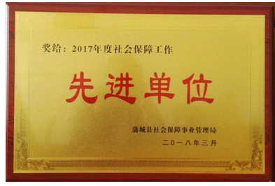
蒲城公司获“2017年度工业经济运行工作先进单位”称号

本报讯(战略发展部 任蒙)3月16日,陕西省室内装饰协会在古都文化大酒店隆重举办第六次会员代表大会暨2016-2017年度陕西省室内装饰行业表彰活动颁奖典礼。尧柏特种水泥集团有限公司荣获陕西省室内装饰行业“优秀装饰材料生产企业”称号。尧柏集团将会更加密切关注产品安全环保,不断创新,努力研发出“尧柏新材”系列高性能专业装饰胶凝剂、瓷砖粘结剂、地面粘结剂等更加健康无污染的装饰材料,提升新材料使用水平,不断满足客户需求,树立良好的品牌形象。