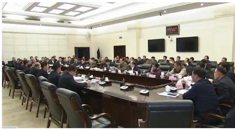
发言和省政府领导讲话精神。

本报讯(行政部 刘鑫)11月19日,陕西省政府召开全省民营企业座谈会,深入学习贯彻习近平总书记重要讲话精神,听取民营企业意见建议,研究解决有关问题。省长刘国中出席会议并讲话。省委常委、省委统战部部长姜锋出席,副省长赵刚主持。