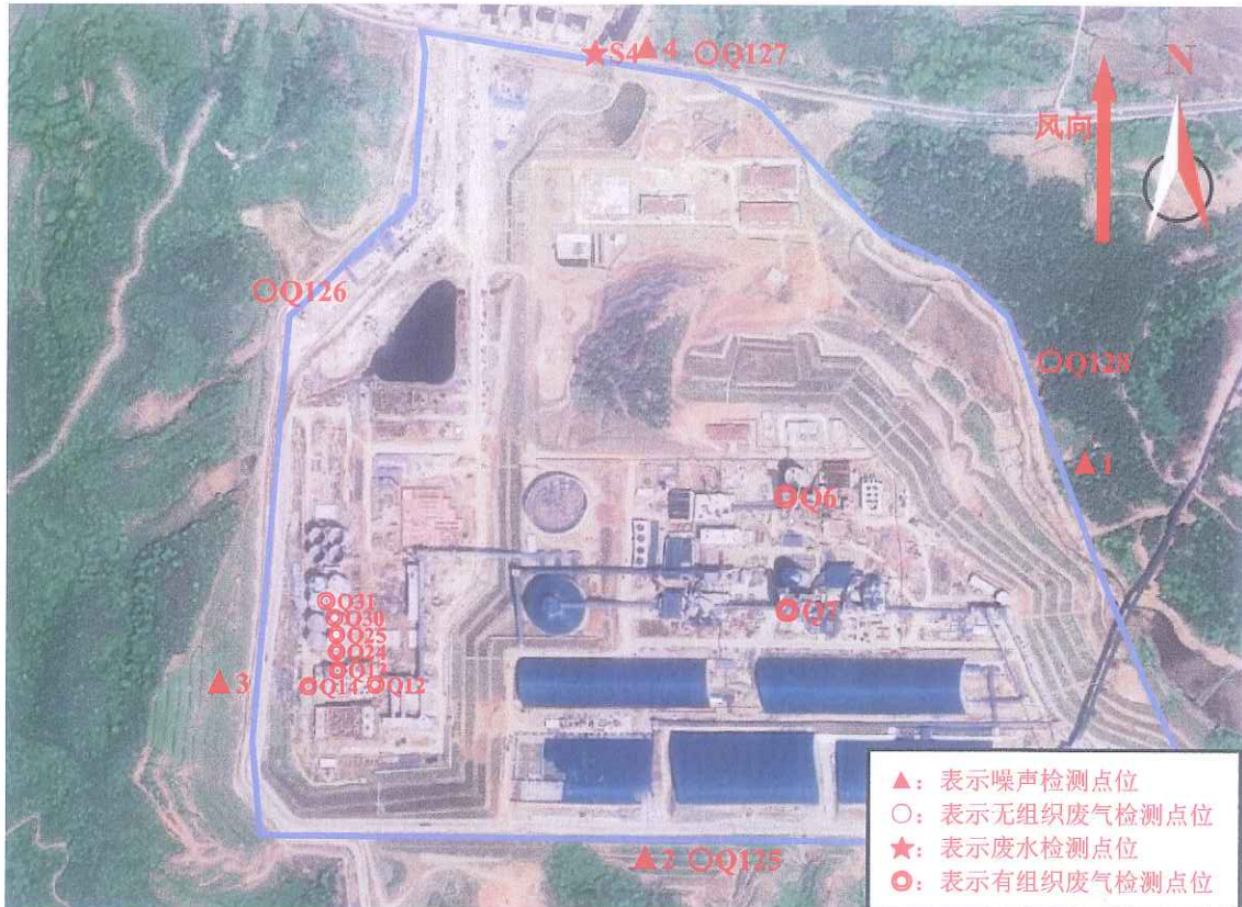
附图 1 江西万年青水泥股份有限公司万年水泥厂 2022 年度第三季度自行监测（新厂区）点位图