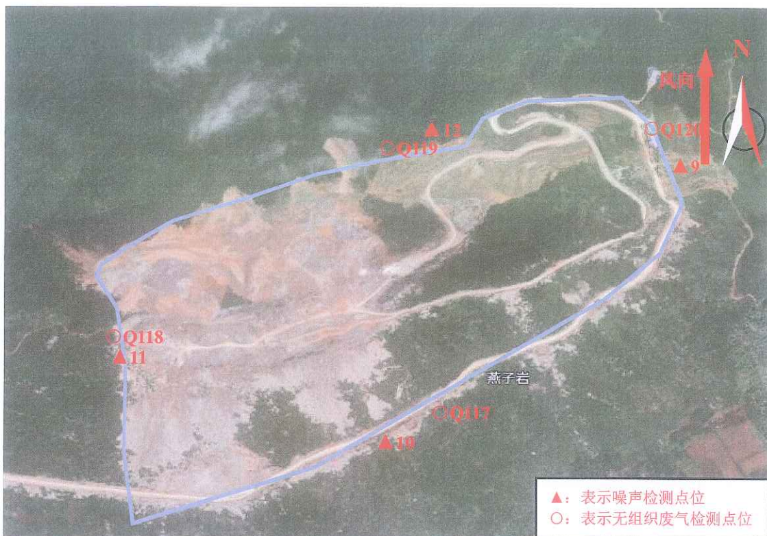
附图3 江西万年青水泥股份有限公司万年水泥厂 2022 年度第三季度自行监测 (鹅岭石灰石矿区) 点位图