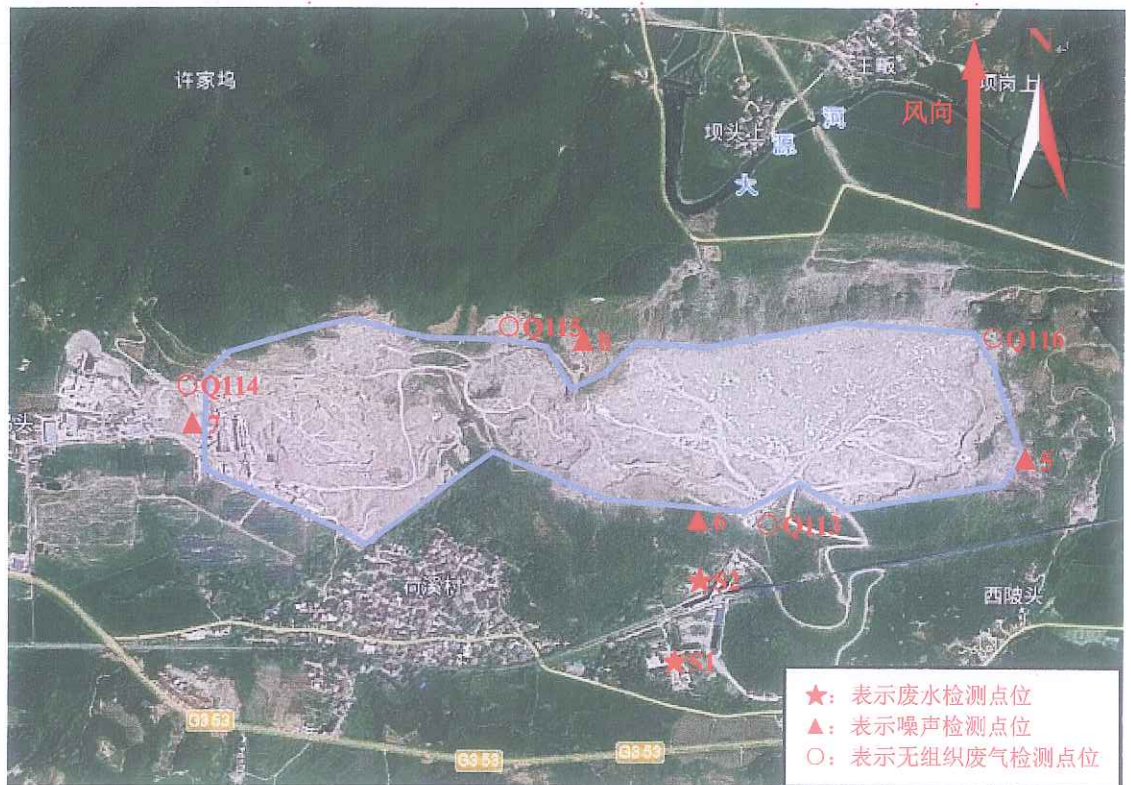
附图 2 江西万年青水泥股份有限公司万年水泥厂 2022 年度第三季度自行监测（石灰石矿区）点位图