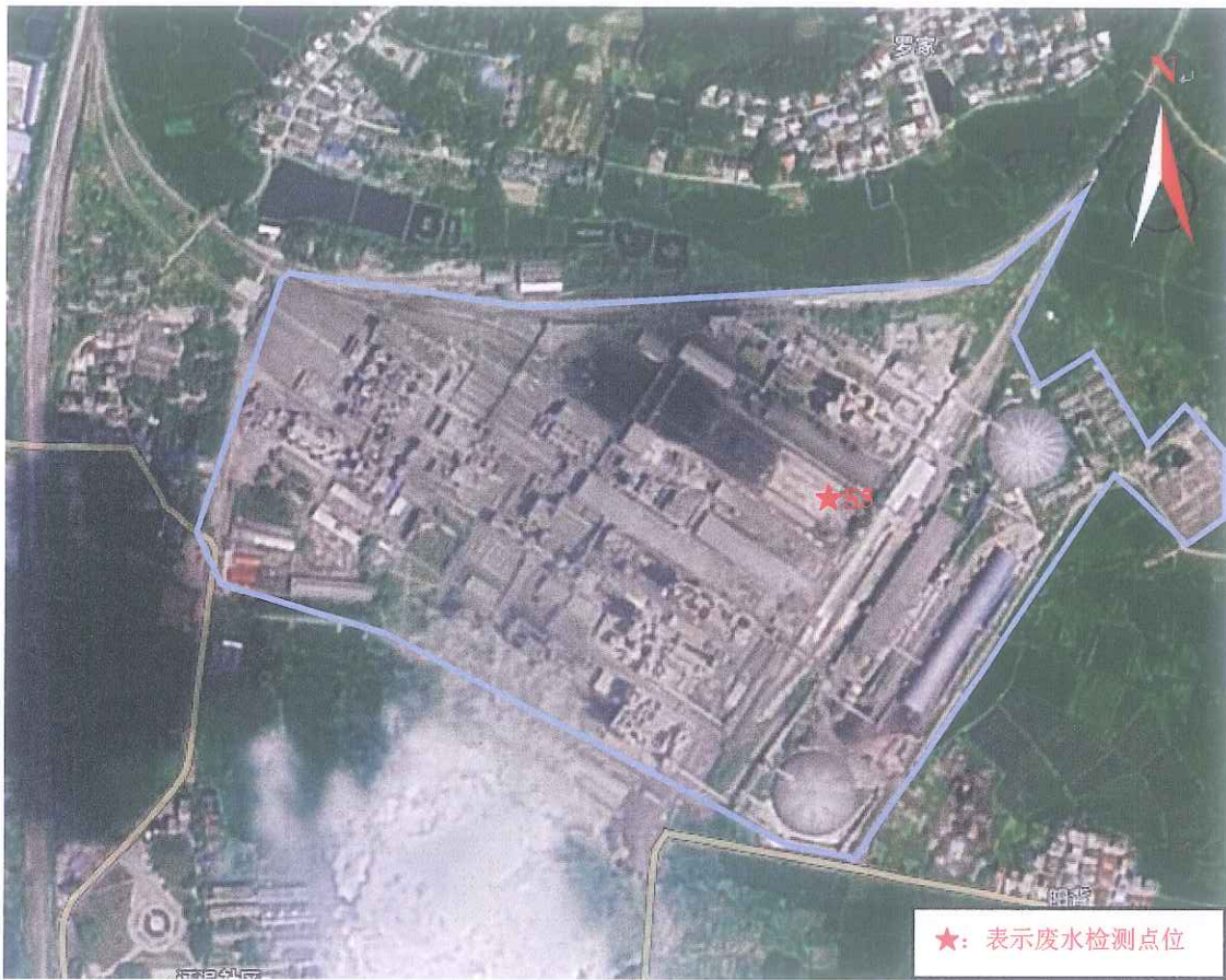
附图 5 江西万年青水泥股份有限公司万年水泥厂 2022 年度第三季度自行监测（老厂区）点位图