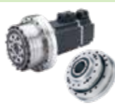
旋轉致動器/諧波減速機