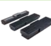
線性馬達定位平台