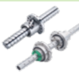
滾珠螺桿/滾珠花鍵