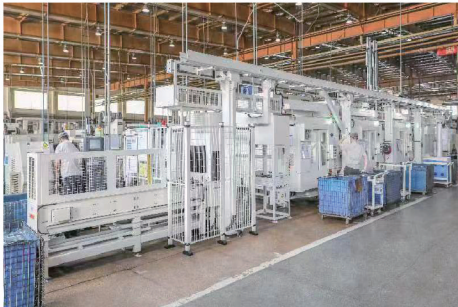
自动化生产线 Automated production line