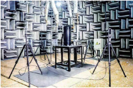
噪声实验室 Noise level lab