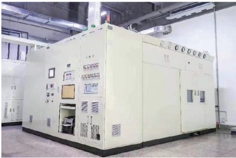
性能实验室 Calorie Meter Lab