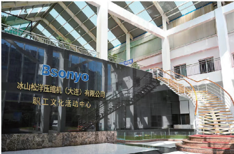
职工文化活动中心 Staff Cultural Activity Center