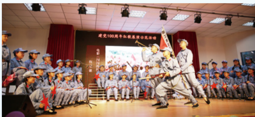
超银中学建党100周年红歌展演尽显艺术才能