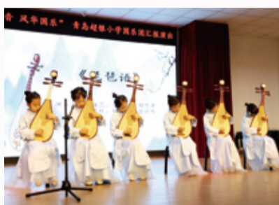
超银小学国乐团“小艺术家”首秀惊艳全场