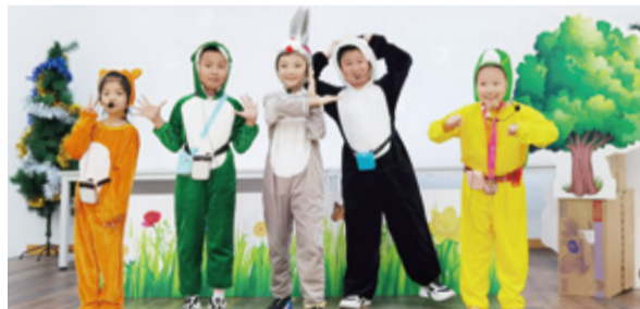
超银未来科技活动室

同学们选故事,写台词,制作头饰、背景、道具,在表演过程中创造性地发挥。一个个精彩有趣的寓言故事表演,不仅展示了他们的艺术才能、语言表达能力,更激发了他们动手动脑和团队合作能力。