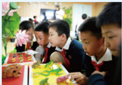
超银小学场馆课程 把动植物园搬进教室