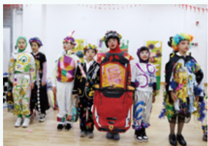
超银小学再闯头脑奥林匹克世界赛 勇夺世界第三