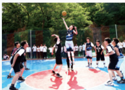
“校长杯”篮球赛 全面展现体育竞技精神