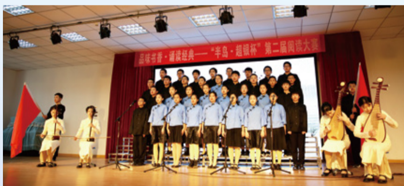
“半岛·超银杯”第二届阅读大赛群英荟萃