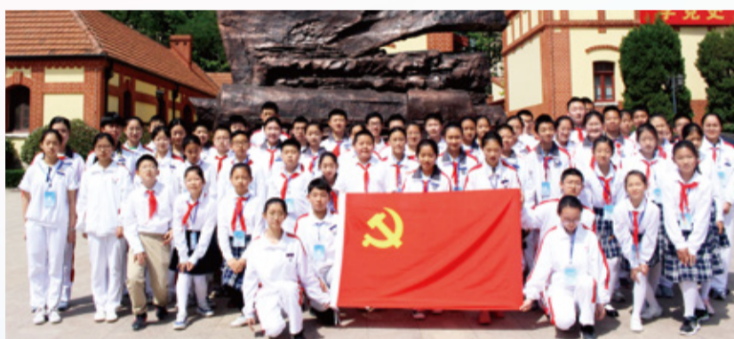
“超音速”小记者走进党史纪念馆进行实地参观采访