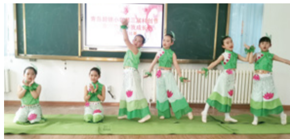
寓言故事伴我成长

每个人对未来都有期望,学生们尽情发挥想象,用生活废旧材料、环保材料制作出心目中的未来城市。