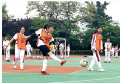
“校长杯”足球赛彰显少年飒爽英姿

超银学校向来重视学生的综合素质培养,通过多元化的校园活动挖掘学生潜能,促进每个超银学子全面发展、健康成长。为深入贯彻青岛市教育局颁布的“十个一”项目行动计划,超银进行了大胆创新与实践,丰富多彩的活动吸引了全校学生的广泛参与,助力超银学子全面提升各项技能。