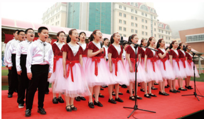
超银学子红歌大合唱献礼建党百年