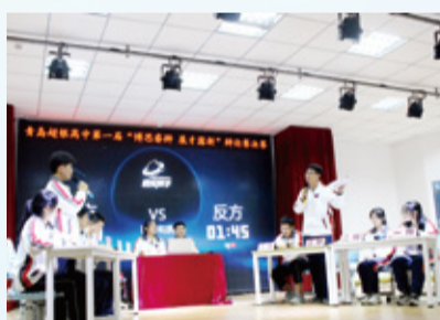
辩论赛上演校园版“唇枪舌战”