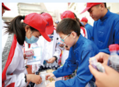
超银中学爱心义卖 将暖意传播四方