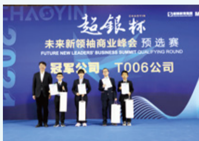
“超银杯”未来新领袖商业峰会 汇聚“商界精英”