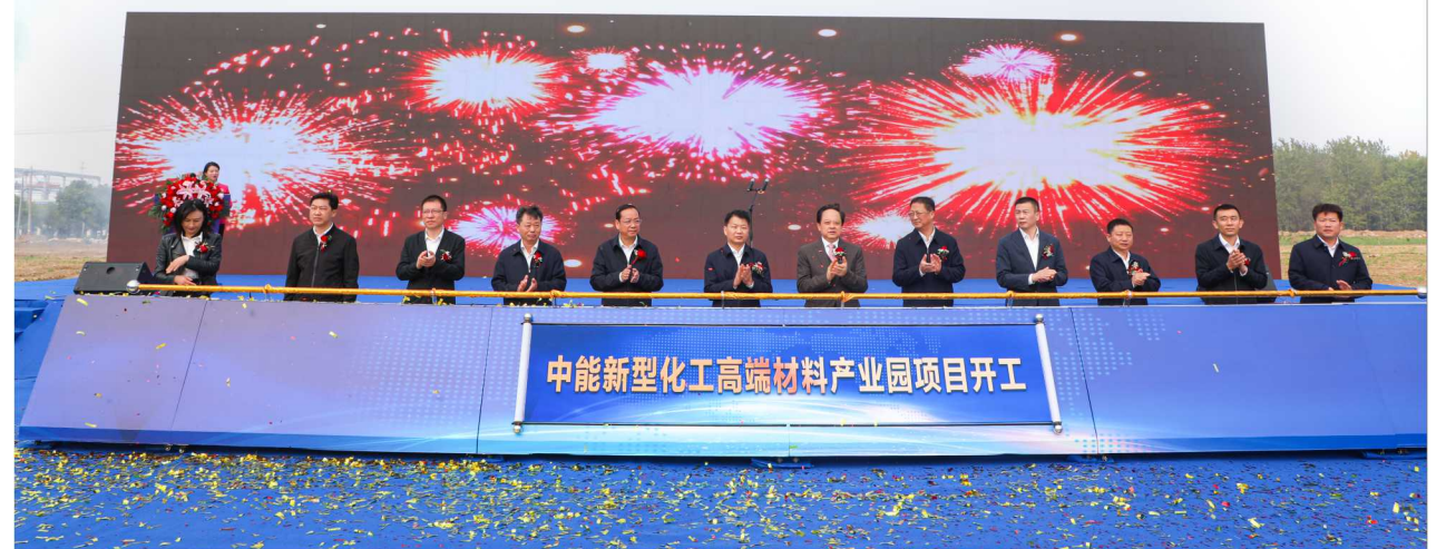
嘉宾推杆启动仪式