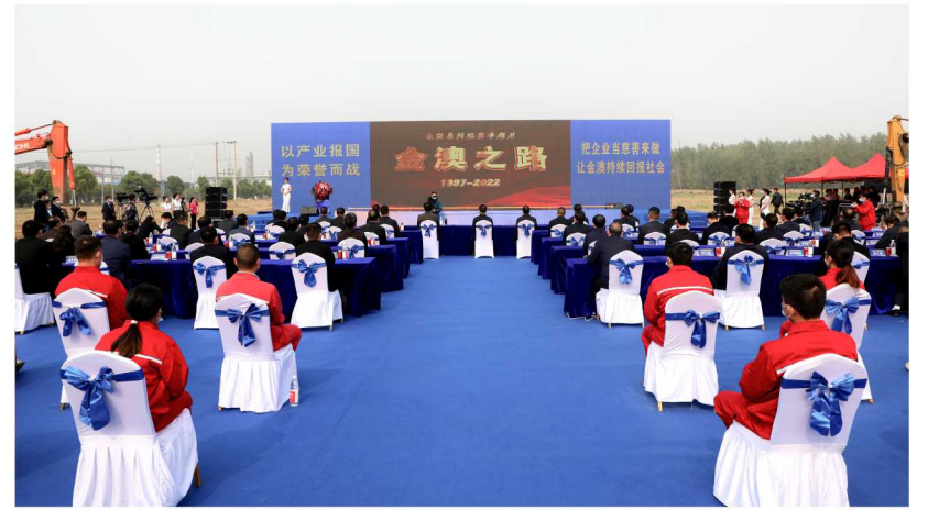
观看大型系列纪实纪录片《金澳之路》