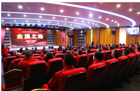
公司干部员工观看《金澳之路》大型系列纪实专题片