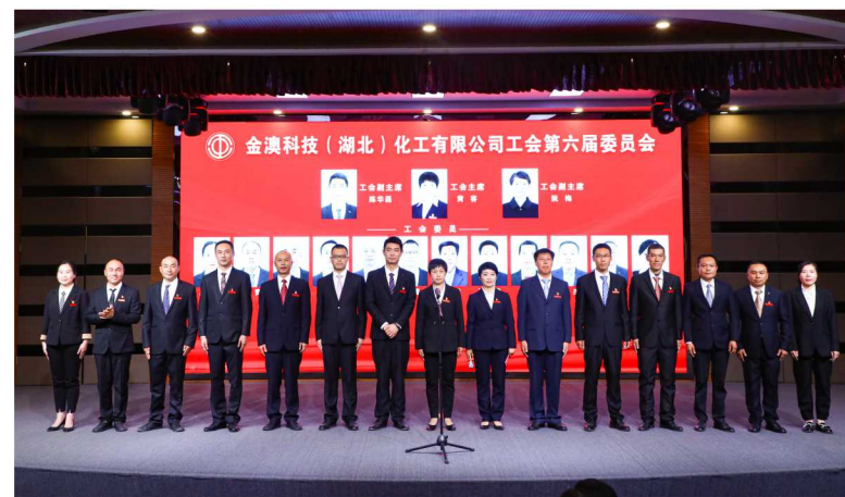
工会第六届委员会委员合影