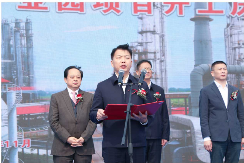
中共潜江市委书记向斌同志现场致辞并介绍集中开工项目总体情况