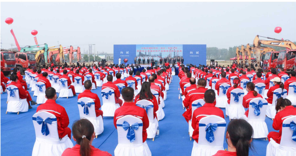
潜江分会场设在中能高端新材料（湖北）有限公司新型化工高端材料产业园项目现场