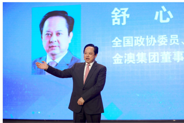
舒心博士作重要讲话