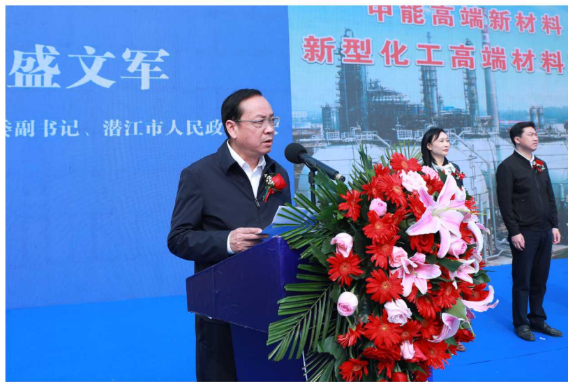
中共潜江市委副书记、市长盛文军同志主持开工仪式