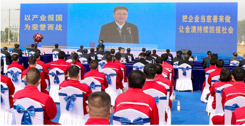
中共湖北省委书记王蒙徽同志宣布四季度全省重大项目集中开工