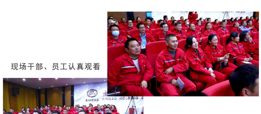
现场干部、员工认真观看