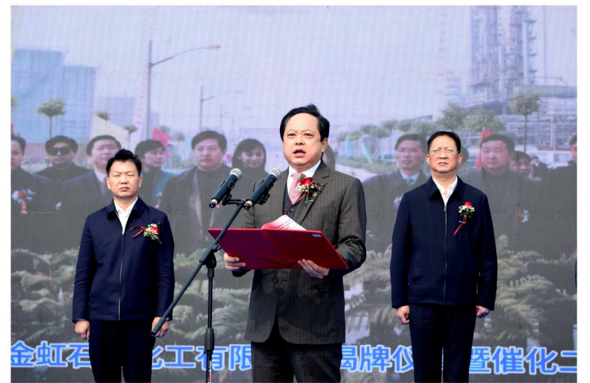
全国政协委员、香港太平绅士、金澳控股集团董事局主席舒心博士致辞