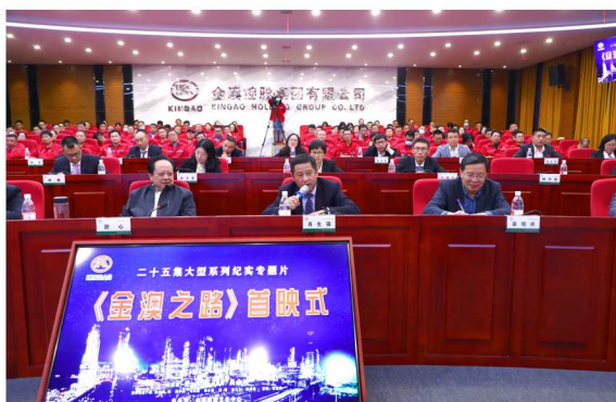
公司高管发表观看感想