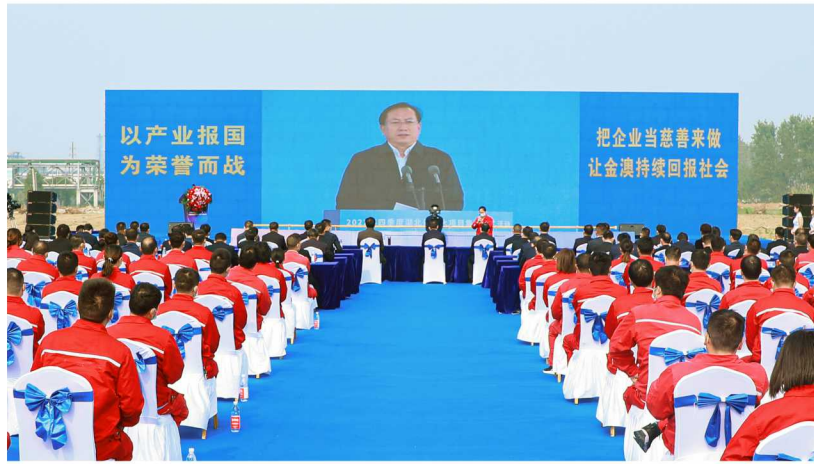
中共湖北省委副书记、省长王忠林同志讲话