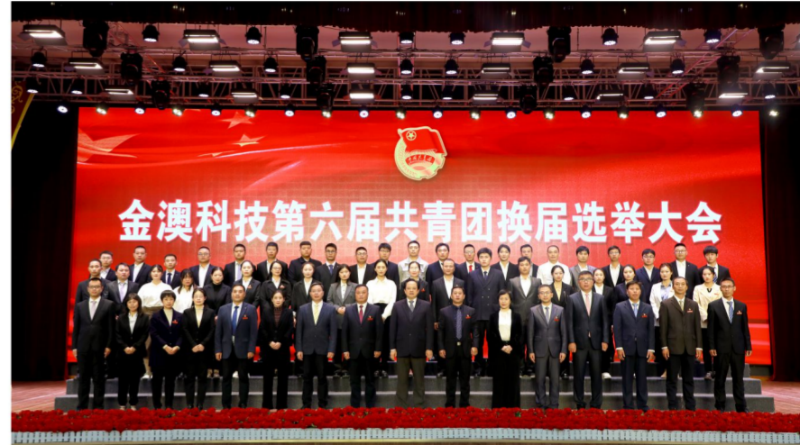
集团领导、公司高管与全体团干合影