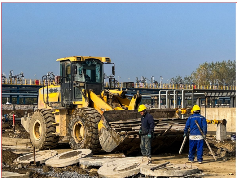
安全施工 拥抱平安 机关团支部

计划财务处月度凭证装订中，大家齐心协力互相帮助，在愉快的气氛中完成了凭证装订工作。