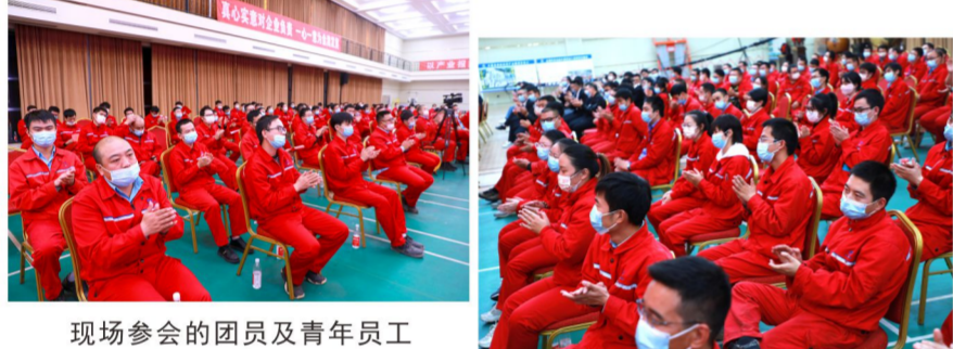
现场参会的团员及青年员工