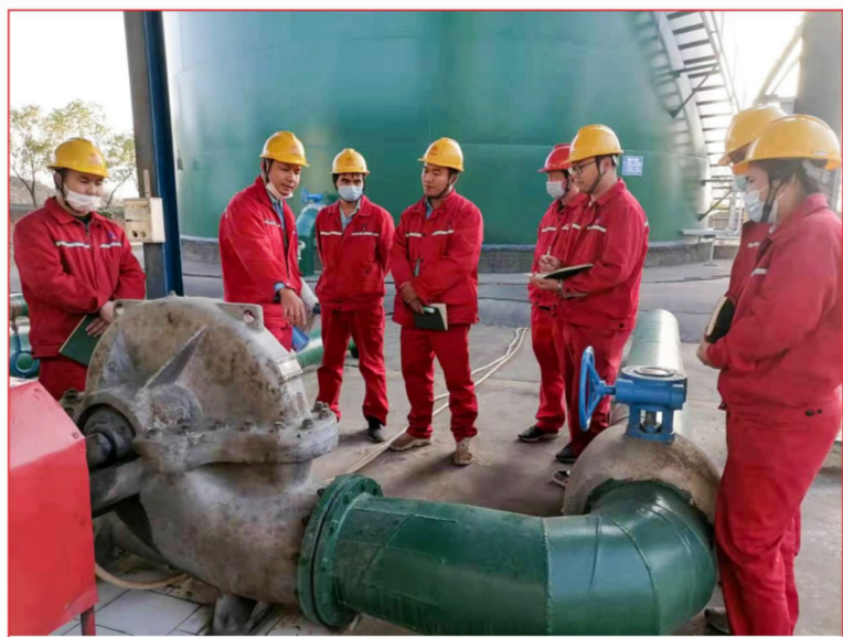
班组学习 化工团支部

我们的城市有太多默默奉献的人，请大家尊重全员核酸的每一位工作人员及志愿者，并为抗击疫情尽自己的绵薄之力！