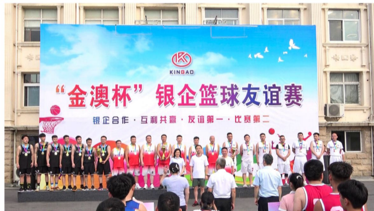
领导与优秀奖队伍合影