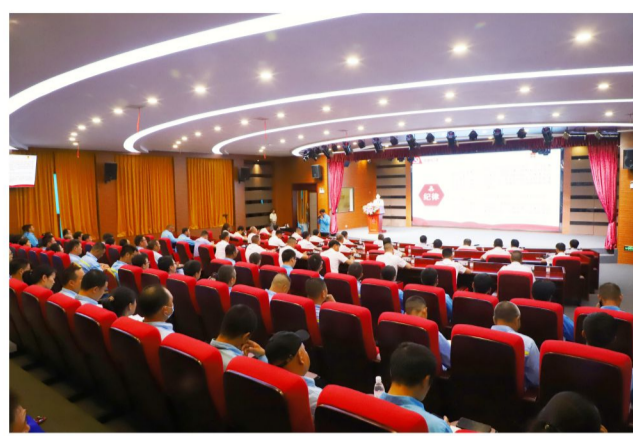
学习《党章》——党的纪律