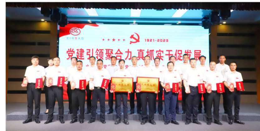
公司领导与获奖人员合影