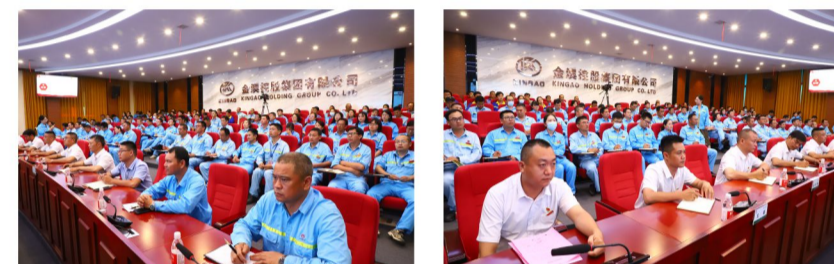
现场党员认真学习