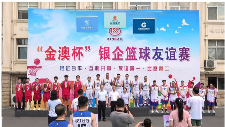
领导与冠军、亚军、季军队伍合影