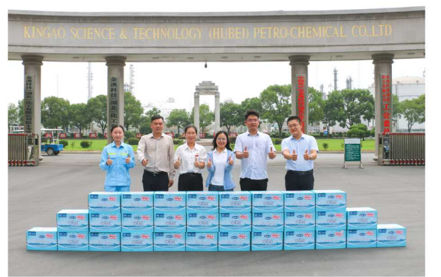
金澳科技工会、团委对各级领导一行专程来公司开展“送清凉”活动表示感谢