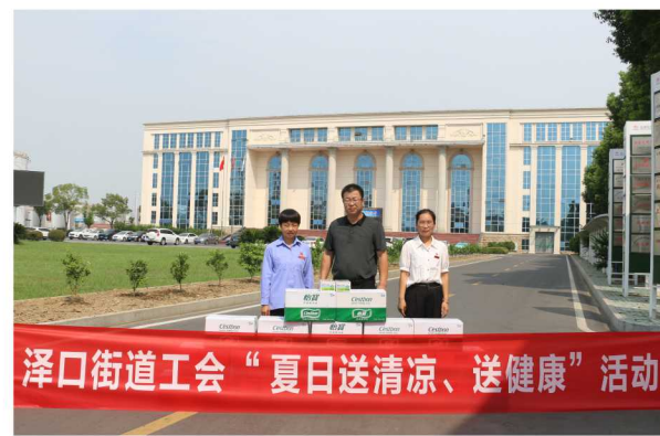
泽口街道工会“夏日送清凉、送健康”活动

措施,发放了矿泉水、人丹、风油精等防暑物资及降温费,致力为广大员工创造良好的工作环境。后期,公司将继续再接再厉,带领全体干部员工立足本岗,不断突破,以昂扬的工作热情为地方经济发展作出新的贡献。