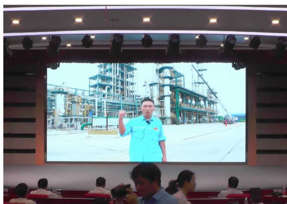
观看家长寄语视频