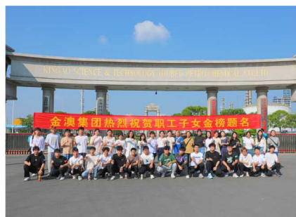
参加活动的家长和学生

大家纷纷表示今后工作中会更加严格要求自己,在岗1分钟,安全60秒,确保装置安全稳定运行,做到快乐工作,快乐生活。