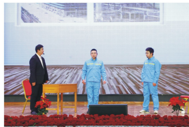
机关、金达团总支表演小品《提意见》