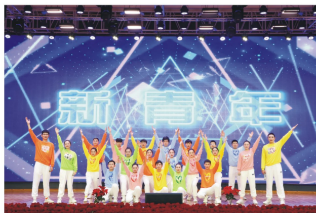
各团总支 表演歌伴舞《新青年》