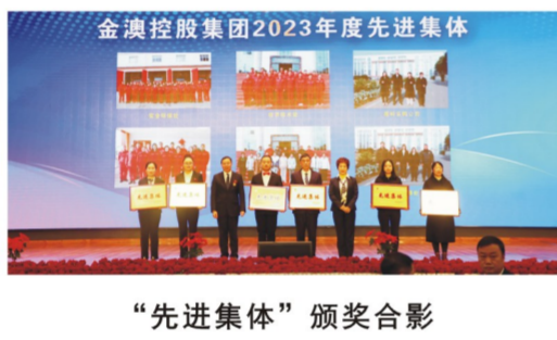
“先进集体”颁奖合影