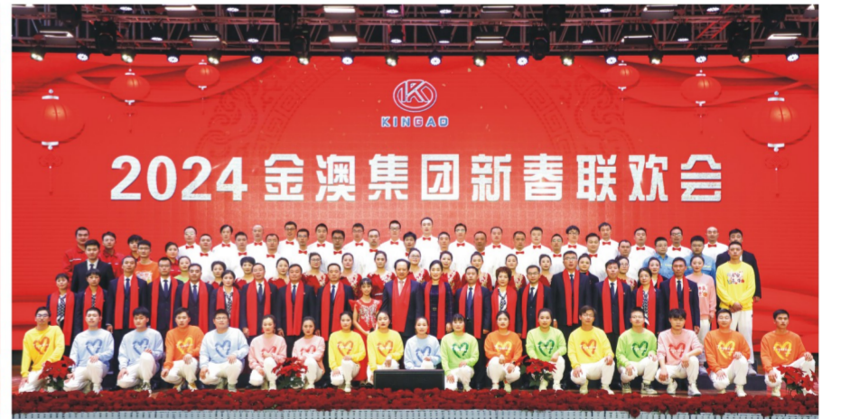
集团领导、公司经营班子与演职人员合影留念