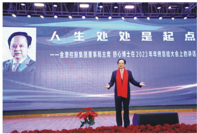
集团董事局主席舒心博士发表讲话