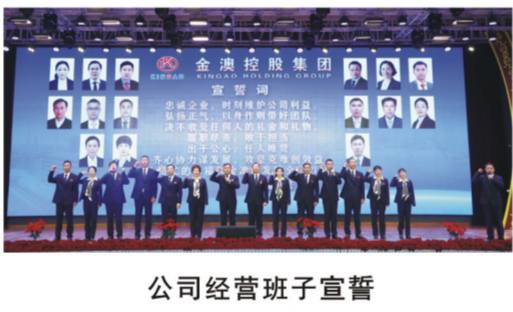
公司经营班子宣誓