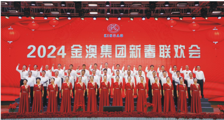
公司中层干部合唱《众人划桨开大船》