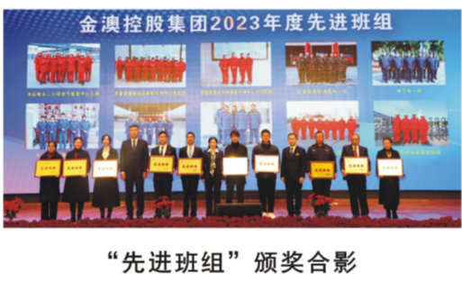
“先进班组”颁奖合影