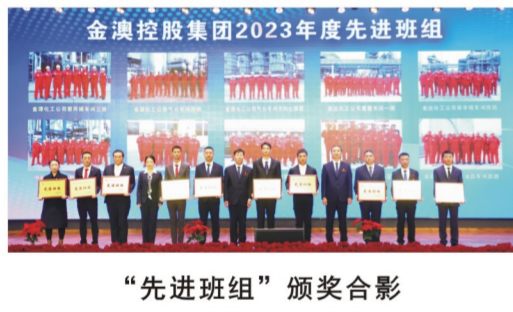
“先进班组”颁奖合影