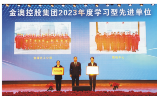
“学习型先进单位”颁奖合影