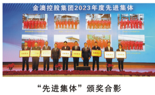
“先进集体”颁奖合影