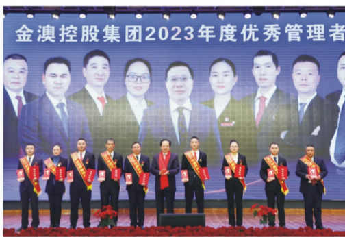
“优秀管理者”颁奖合影