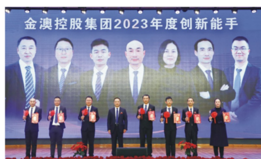
“创新能手”颁奖合影