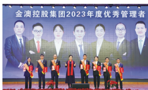
“优秀管理者”颁奖合影