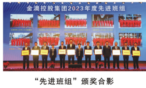
“先进班组”颁奖合影