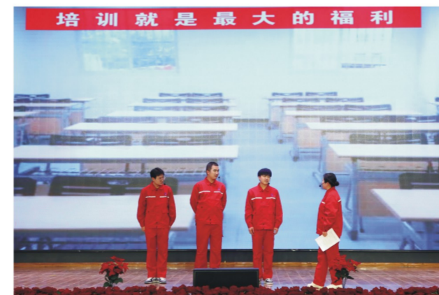
动力、化工、维修团总支表演小品《班组安全故事》