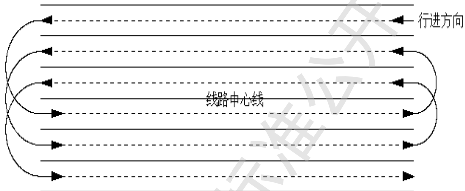
图1 施工作业场地较宽时冲击碾压路线示意图

8.2.3.1 施工作业场地宽度大于冲击压路机转弯半径的四倍时，以道路中心线为对称轴从一侧向另一侧采取错轮回转法进行冲击碾压，碾压时轮迹不得重叠，具体行车路线见图1；施工作业场地的宽度小于四倍转弯半径时，可按图2的方式进行冲压，并根据实际情况在施工作业场地的两端设置所需的转弯场地。