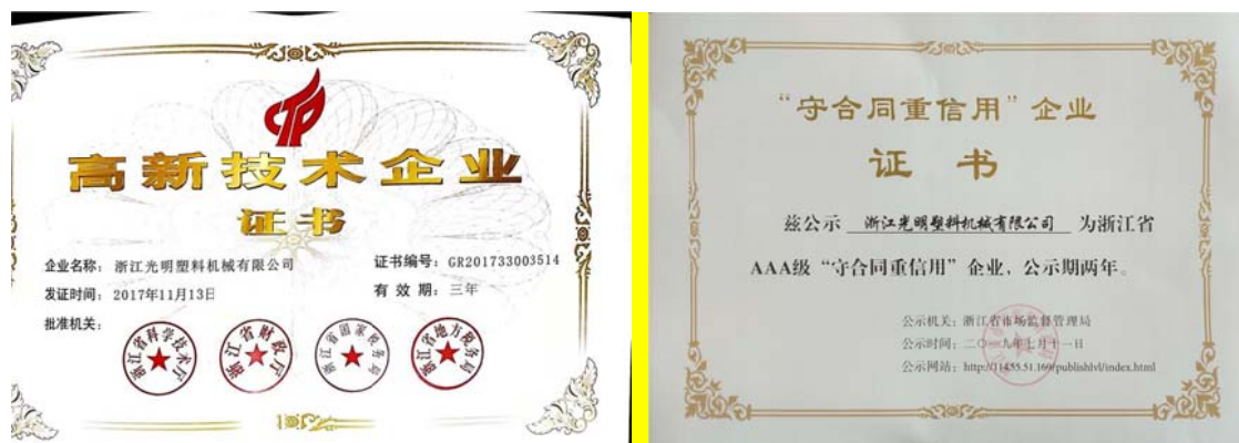
图 3.3-1 社会认可的证书（示例）

问题与客商发生过纠纷，深受国内外客户的信赖。为此，公司先后获得政府颁发的“安全生产标准化三级企业”、“高新技术企业”、“浙江省商标品牌示范企业”、“浙江省名牌产品”、“浙江省商标品牌示范企业”、“浙江省管理创新试点企业”、“浙江省服务型制造示范企业”、“浙江省 AAA 级守合同重信用企业”、“舟山市两化融合示范企业”等荣誉，如图 3.3-1 所示：