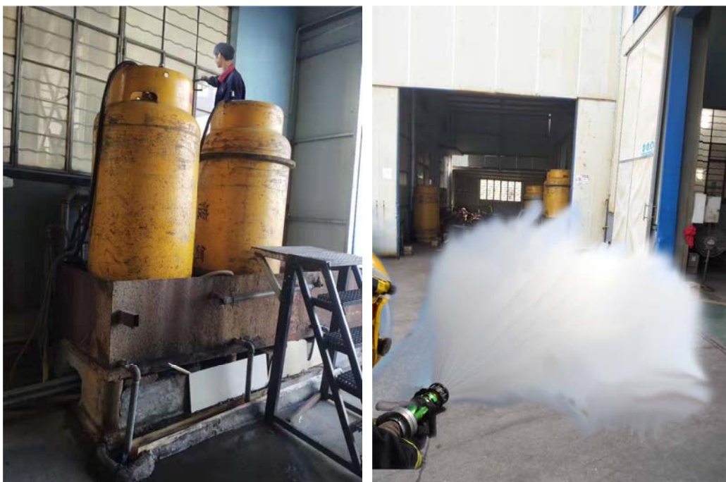
图 6.3-01 消防应急演练现场