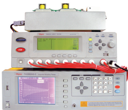
TH9201S+TH2882A+TH90010 测试方案 (交直流耐压+绝缘电阻+匝间绝缘扫描测试方案)