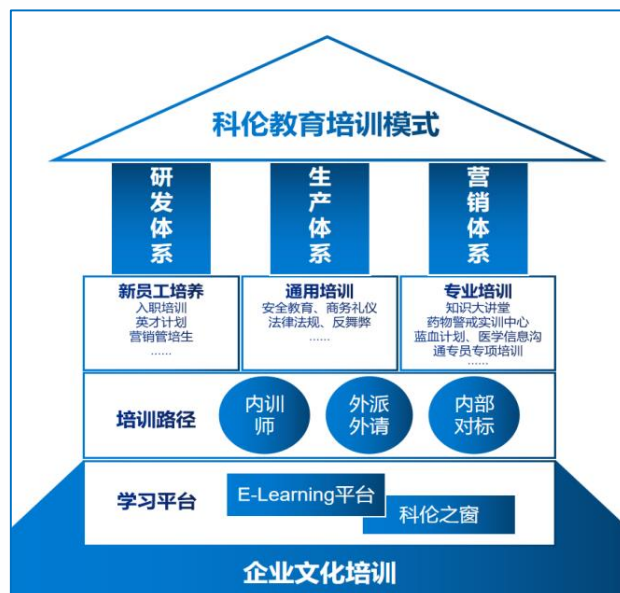
图 1-1 科伦培训教育模式

公司十分重视人才综合素质能力的培养，分层次、分类别地开展了内容丰富、形式灵活的员工培训，包括但不限于员工专业技能培训、安全生产及职业健康培训、管理培训、内训师队伍建设、企业文化宣贯、以会代训、对标（内外）学习、外派外请、精益管理等项目，为员工提供充分的学习赋能机会，推进公司的人才培养计划，促进高素质人才队伍建设，助力公司可持续发展，科伦教育模式见图 1-1。